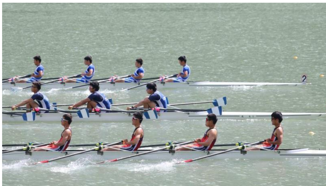
全国選抜大会 鹿屋工業高校男子4×+ 3位入賞